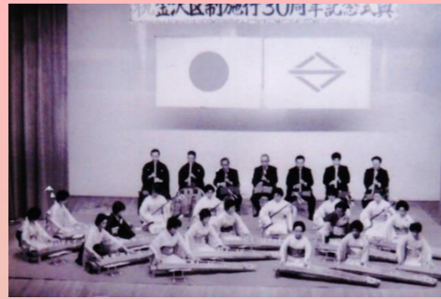
1978年5月にはじめの一步 金沢区制施行30周年記念式典での演奏が初演