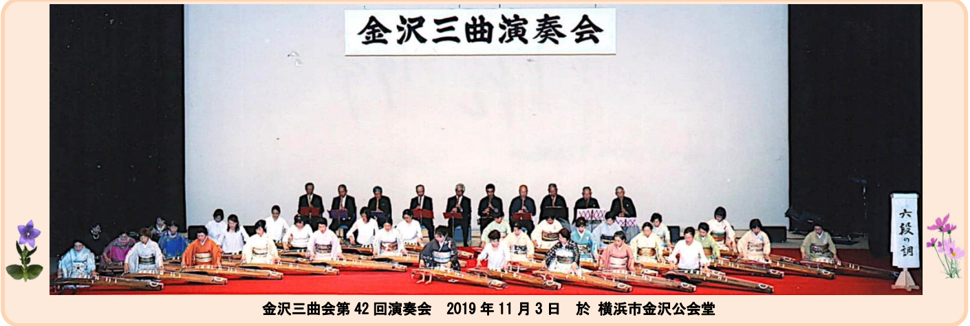
金沢三曲会第42回演奏会 2019年11月3日 於 横浜市金沢公会堂