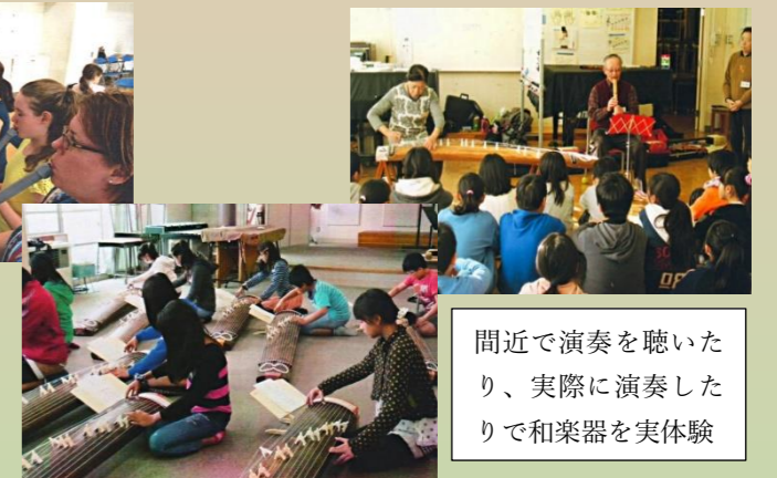
間近で演奏を聴いたり、実際に演奏したりで和楽器を実体験