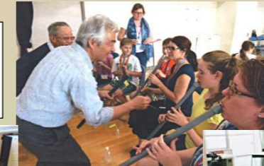
オーストラリアの姉妹校から西釜利谷小に来校中の生徒に和楽器の授業

1996年、校長会にて趣旨を説明、釜利谷東・小田小の2校から始まりました。多いときは1年に15校を数えました。区内の小・中学校に和楽器を持参、体験授業を行い、日本の文化に親んでもらっています。