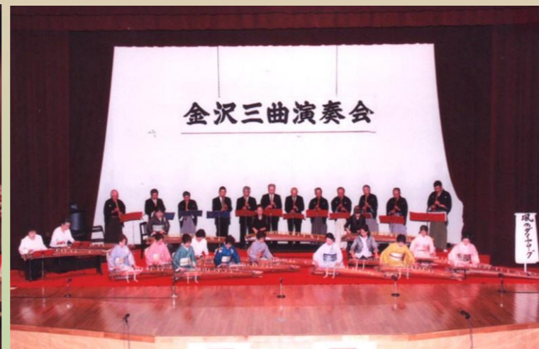
2012年11月 創設35周年記念演奏会 金沢区の風景と歴史をモチーフにした委嘱曲「風のダイアログ」を初演