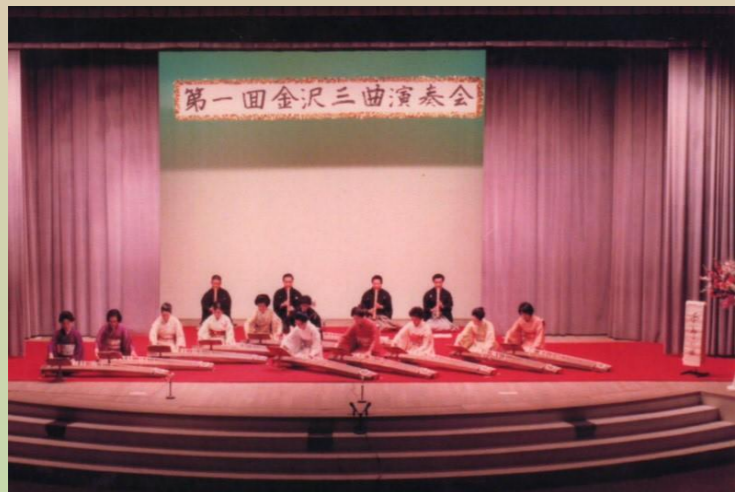
1978年11月 第1回金沢三曲演奏会 「千鳥の曲」を演奏

区や団体の催し(ミニ体験講座・生涯学習フェスティバル・フォーラム KANAZAWA・金沢芸術祭など)に参加し、邦楽の普及と地域文化の向上に努めています。