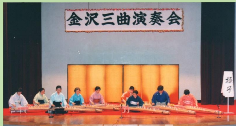
1995年10月 流派を超えた合同演奏