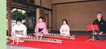
旧伊藤博文金沢別邸 秋の催し