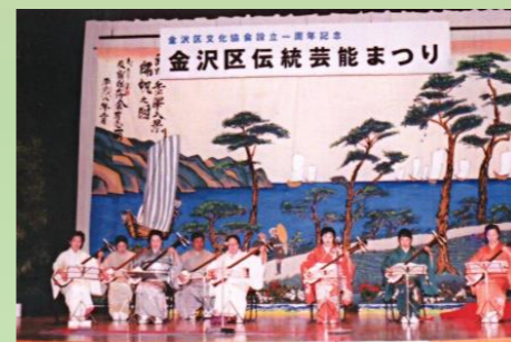
金沢区文化協会設立一周年記念 金沢区伝統芸能まつり