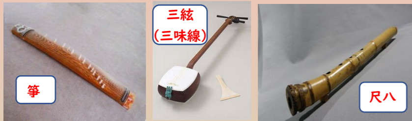
箏の音楽、三絃の音楽、尺八の音楽およびこれらの楽器を組み合わせた音楽を総称して三曲といえます。

演奏会(年1回)・研究会(年2回)の開催、区内の小・中学校訪問(邦楽体験授業)、区内の各催しに参加をしています。