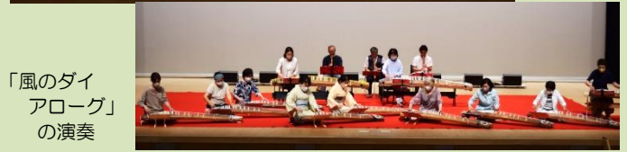
「風のダイアログ」の演奏