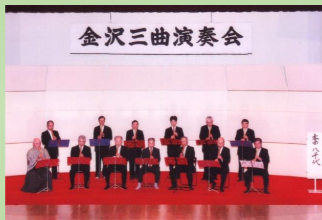
2011年11月 尺八全員集合